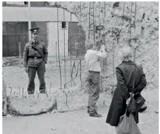
Berlin Prenzlauer Berg, Dezember 1989