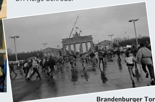
Brandenburger Tor, Berlin-Mitte, Dezember 1989