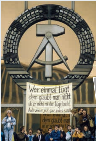
Demonstranten mit Transparent vor dem Palast der Republik, 4.11.1989