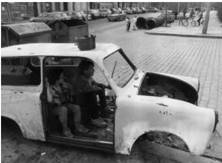
Teutoburger Platz, Berlin, 1990, Deutschland

Der Auszug aus einem der bekanntesten Pionierlieder der DDR skizziert zwei Ziele der Einbindung der Jugend der DDR in die staatlichen Jugendorganisationen. Zum einen die Schaffung eines durch gemeinsame Erlebnisse hervorgerufenen Gemeinschaftsgefühls, zum anderen die enge Bindung an den sozialistischen Staat unter Führung der SED. „Auf dem Wege weiter, den uns die Partei gewiesen...“ heißt es folgerichtig in der letzten Strophe des Liedes. Aber wie sah es mit Anspruch und Wirklichkeit aus? Gelang es den Funktionären eine „Kampfreserve der Partei“ zu schaffen, wie es in Reden der Parteiführer immer postuliert wurde? Trugen die Jung- und Thälmannpioniere mit Stolz ihr Halstuch oder zogen die Jugendlichen nur widerwillig die blauen FDJ-Hemden über? Resultierte vielleicht sogar aus der verordneten Eingliederung in die Organisationen widerständisches Verhalten mancher Jugendlicher?