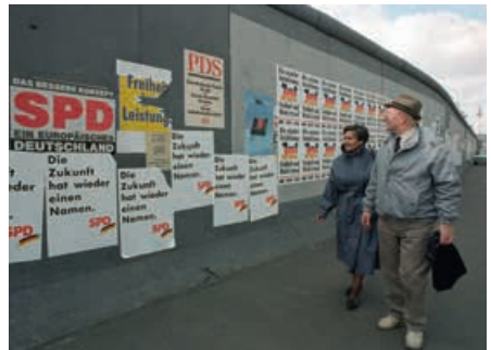
Wahlplakate an der Berliner Mauer – Wahlkampagne für die ersten freien Wahlen in der Geschichte der DDR, Ost Berlin 12.03.1990