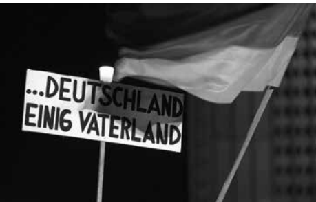
Parole zur Wiedervereinigung auf dem Opernplatz, Leipzig, 18.12.1989

Analyse der deutsch-deutschen Nachkriegsgeschichte? Da ist zunächst die asymmetrische Verflechtungsgeschichte zweier deutscher Staaten von 1949 bis 1990, dann eine (andere?) asymmetrische Verflechtungsgeschichte zweier Landesteile eines wiedervereinigten Landes im Transformationsprozess – und wie sehr wirkt diese Geschichte in die Zukunft Deutschlands? Lassen sich beispielsweise in den Vergleichsmustern von Demokratie und Diktatur oder von staatlich gesteuerter Planwirtschaft und staatlich begrenzter Marktwirtschaft, Erkenntnisse für einen auf die Gegenwart bezogenen Unterricht gewinnen? In diesem Sinne spricht diese Tagung nicht nur die Geschichts-, sondern auch die Politik-, Wirtschafts-, Gesellschafts- und Ethiklehrkräfte an.