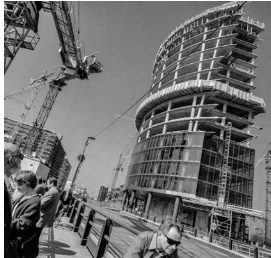
Berlin im Umbruch – Bauaktivitäten am Potsdamer Platz, um 1995